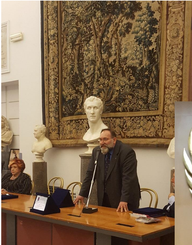
Il 3 maggio 2017, al Campidoglio in Roma, riceve il premio (VI edizione) Duelli-Gallitto.