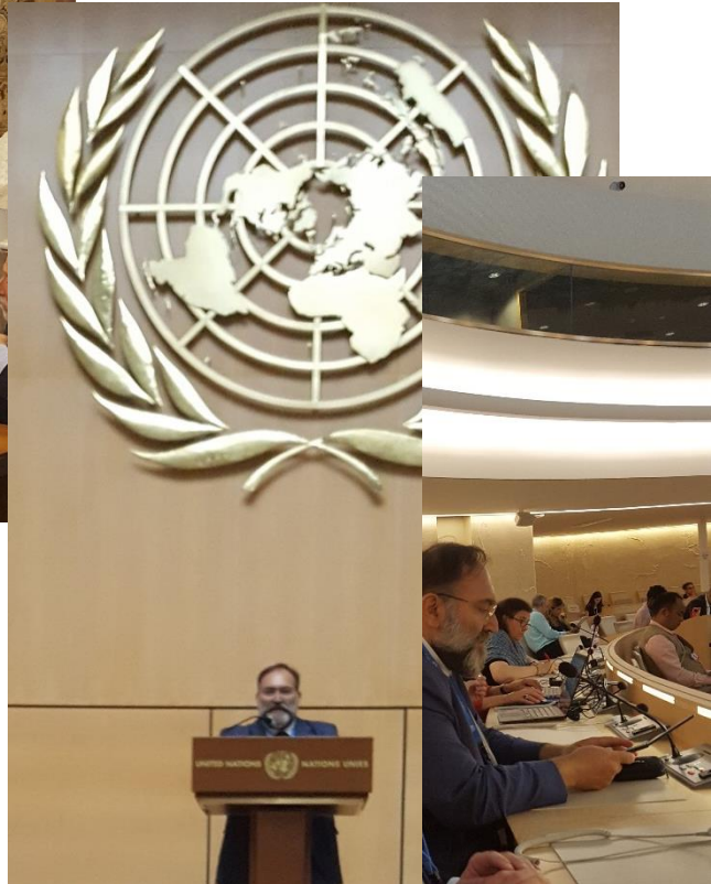
Il 21.06.2017 è nominato C.T. per il Comune di Vigo di Fassa (TN) ed inserito nella rappresentanza permanente, per la preservazione della lingua Ladina, presso la sede O.N.U. di Ginevra